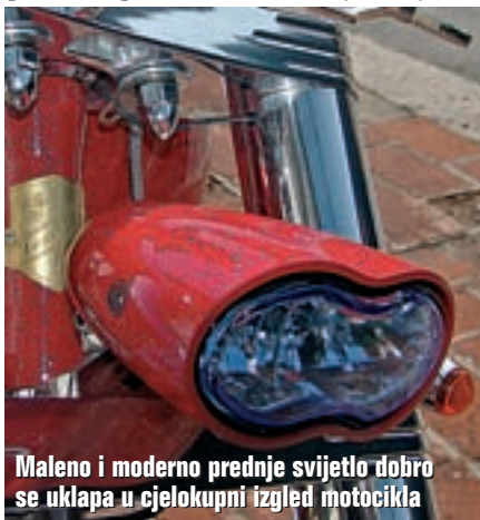
Maleno i moderno prednje svijetlo dobro se uklapa u cjelokupni izgled motocikla

Već opisane gume montirane na polirane aluminijske naplatke proizvođača do-